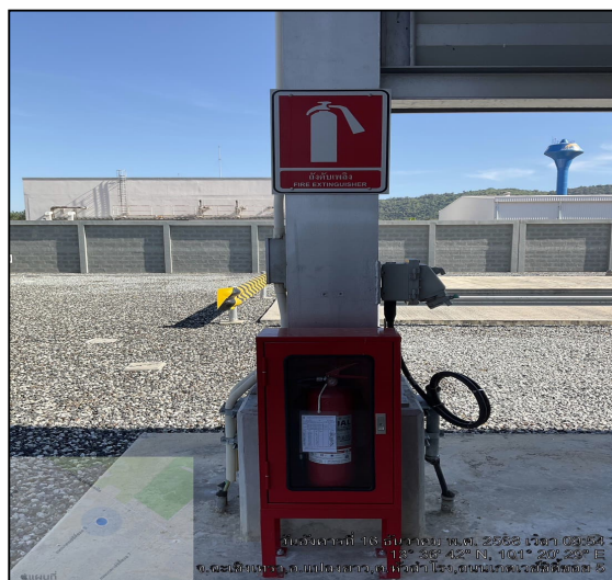
ถังดับเพลิง

ภาพที่ 3.2-3 ภาพถ่ายแนวเส้นทางท่อและการติดตั้งป้ายเตือนแนวท่อส่งก๊าซธรรมชาติไปยังโครงการท่อส่งก๊าซธรรมชาติไปยังกลุ่มลูกค้าอุตสาหกรรมภายในนิคมอุตสาหกรรมเกตเวย์ ซิตี้