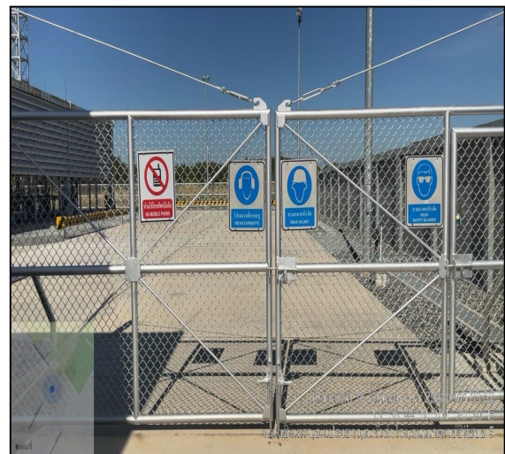
ป้ายเตือนความปลอดภัย