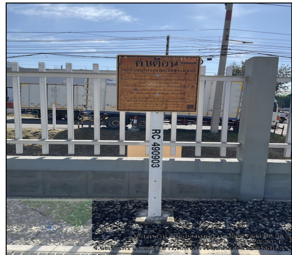
ป้ายเตือนแนวท่อส่งก๊าซธรรมชาติ