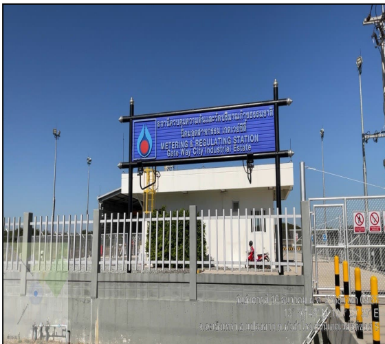
สถานีควบคุมความดันและวัดปริมาณก๊าซ